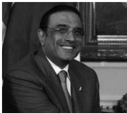
پرزیدنت آصف علی زرداری رئیس جمهوری پاکستان

در افغانستان، مقامات دولت اوپاما دریافته اند که آغاز سوء استفاده و فساد امرای ارتش نزدیک به دولت پرزیدنت حمید کرزای باعث تجهیز و محبوبیت بیشتر طالبان در افغانستان شده است. پس از انتخابات ریاست جمهوری در افغانستان دولت اوپاما سعی کرده است کرزای را از مقاماتی که دستشان به خون آلوده است ویا متهم به سوء استفاده مالی هستند دور نگهدارد. با این حال هنوز معلوم نیست که آیا واشنگتن آماده است رشته همکاری