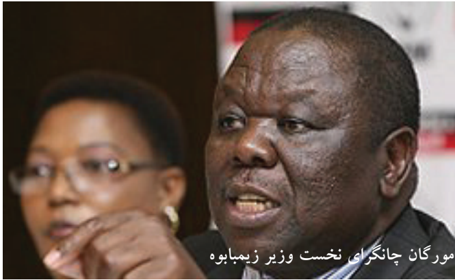
مورگان چانگرای نخست وزیر زیمبابوه

درست است که ماه گذشته احمدی نژاد به دیدار همتای دیکتاتور خود رابرت موگابه به زیمبابوه رفت. اما نخست وزیر این کشور افریقایی در اعتراض شدید به سفر او خطاب به رئیس جمهور سفروی رارسوئی سیاسی بزرگ کشورش توصیف کرد و نه تنها احمدی نژاد را پذیرفت بلکه گفت ما انتظار داریم مقامات کشورمان از همکاری با ظالمان دست بردارند. مورگان چانگرای گفت دعوت از عنصر مستبد رژیم حاکم بر ایران مانند دعوت از پشه برای درمان مالاریا است و سفرش ته تنها توهین به مردم زیمبابوه که اهانت آشکار به مردم مظلوم ایران است